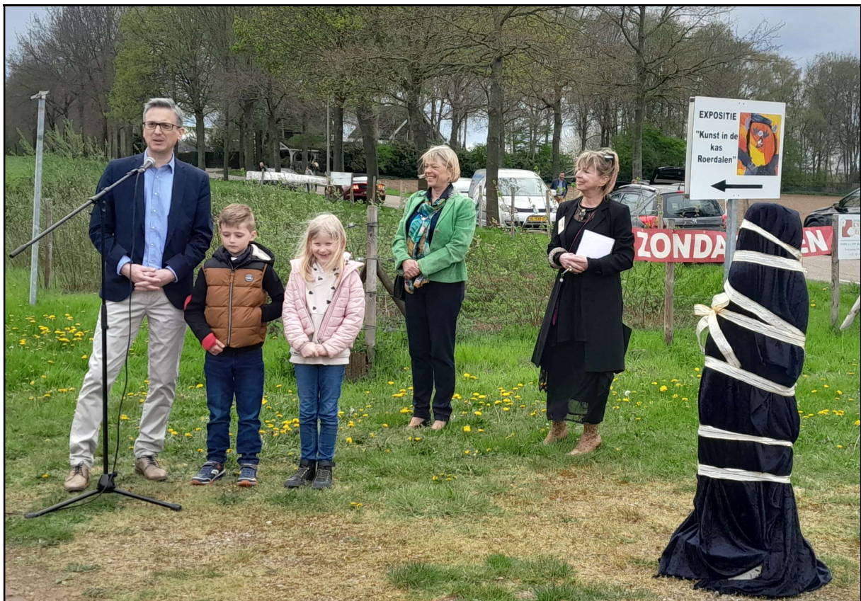
Foto: Marcel Maurer, Kinder der GGS Am Burgberg, Monique de Boer-Beerta, Marleen Hansen (© Sabrina Martin)

Mehr Informationen unter www.kunstindekasroerdalen.nl