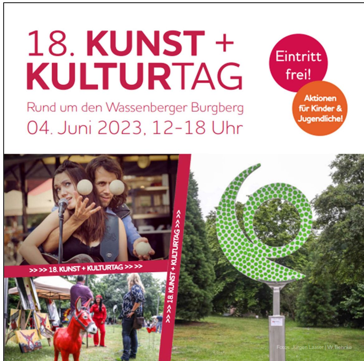
Foto: Auszug aus dem Flyer der Kunst, Kultur und Heimatpflege Wassenberg gGmbH